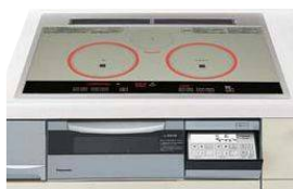
IHクッキングヒーター