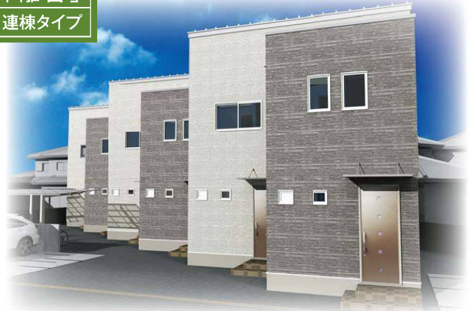
※賃貸住宅として(土地活用)